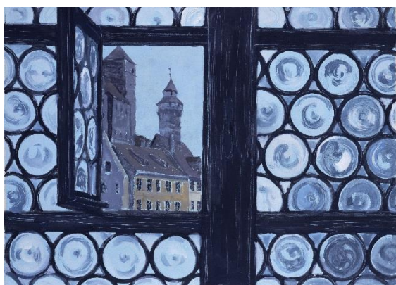
東山魁夷 《デューラーの家より》 1969年 長野県信濃美術館 東山魁夷館蔵 【前期展示】