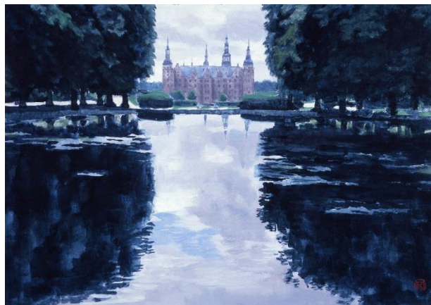
東山魁夷 《フレデリク城を望む》 1962年 長野県信濃美術館 東山魁夷館蔵 【前期展示】