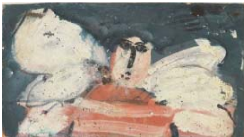
ロベール・クートラス 《天使》