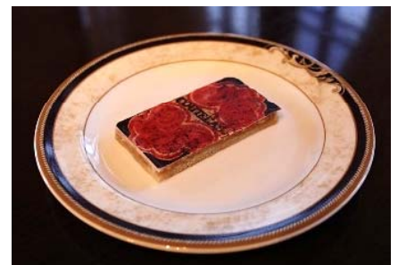
※ 3種類から選べます