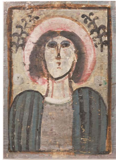
ロベール・クートラス 《僕のご先祖さま》