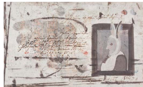
ロベール・クートラス 《僕のご先祖さま》